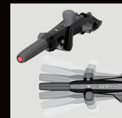
アジャスタブル ティラーハンドル

4ストローク15/20馬力に標準装備。大型のティラーハンドルとシフトレバー(ハンドル部に配置)により操作性が大幅に向上。上下、左右にも調節できますので操船しやすいポジションに調節可能です。