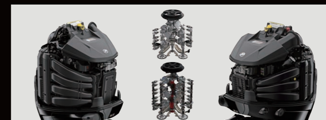
最新技術により軽量化と大排気量を実現 V6-3.4L、V8-4.6L

115馬力(質量/163kg/L)、150馬力(質量/206kg/L)はいずれも同馬力クラスで最軽量です。排気量は、115馬で2,061cc(4気筒)、150馬力ではクラス最大の3,000cc(4気筒)の大排気量により頼もしいパワーとトルクを発揮します。