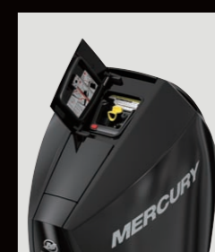
トップカウル開閉

40~60馬力に装着モデルを設定しました。一クラス上のギアケースを装着することで、より大きなプロペラの取り付けが可能となり強い推進力が得られます。大型のアンチベンチレーションプレートも空気の混入を抑え推進効率をアップさせます。耐久性、信頼性も一クラス上の性能です。