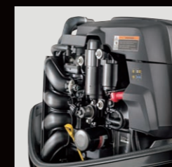
クラス最軽量で最大排気量 L4 / 115HP、150HP

40馬力以上にスマートクラフトシステムを標準装備。専用ゲージにより使用時間、回転数、燃料流量/消費量、エンジン温度、油圧、水圧、電圧などが確認できます。エンジンガーディアン機能により、不具合発生時は警告アイコン、メッセージを表示し(専用ゲージ装着時)エンジン回転を制御し船外機を保護します。